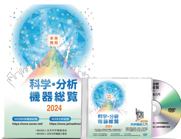
科学・分析機器総覧印刷版とDVD版(画像は昨年のもので)

今年9月に発行を予定している“科学・分析機器総覧 2025”印刷版・DVD版の無料配布について予約申込を受付けます。